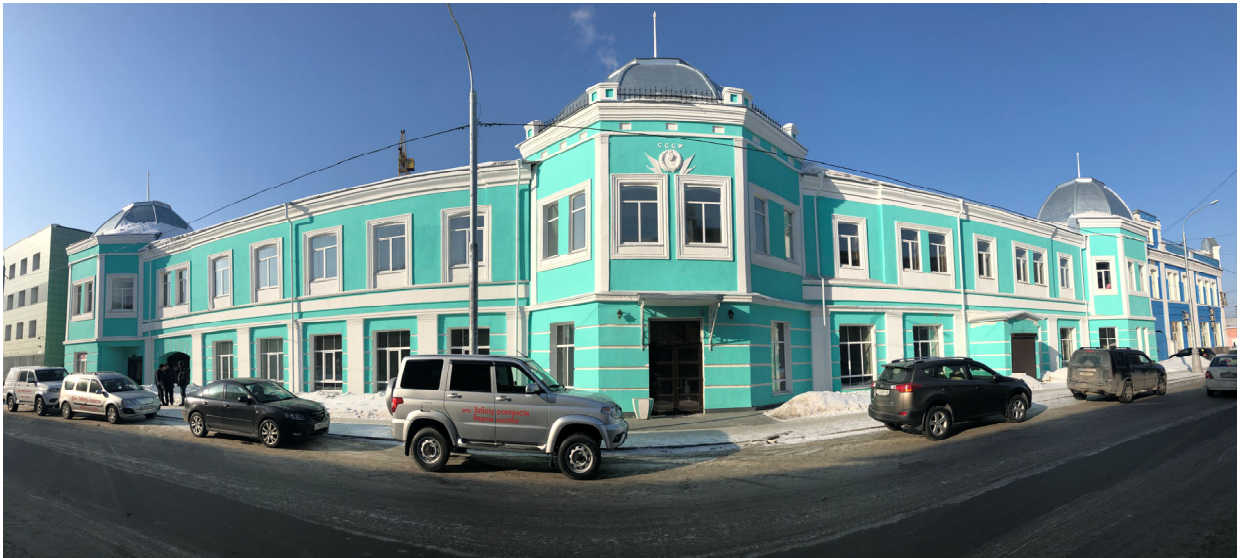
Фасад и купола после ремонта 2018 г.