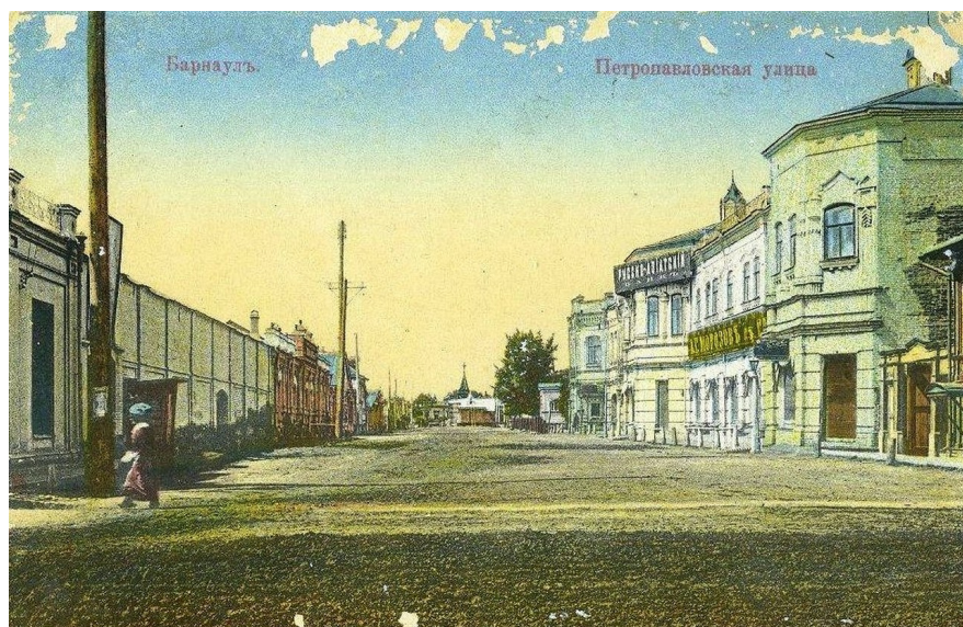
Петропавловская улица (ныне ул. Ползунова) при пересечении с Московским (ныне Ленинским) проспектом Открытка начала XX века. Справа – Дом Морозова

В 1913 г. Торговый дом «А.Г. Морозов и Сыновья» имел в этом здании оптовый мануфактурный магазин, розничный галантерейный магазин и вино-бакалейный магазин, верхний этаж занимал Русско-Азиатский банк. Позже внизу находился магазин «Сотрудник» и колбасная лавка.