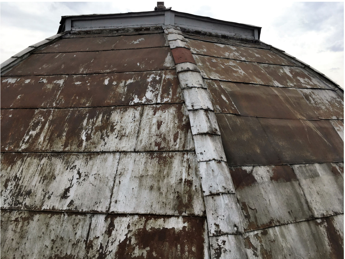
Кровля 2017 г.