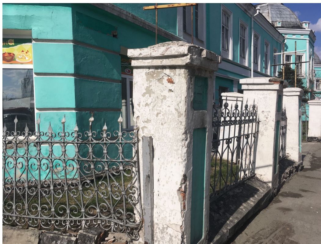
Ограда и фасад здания в 2017 году

В советский период, в 50-60-е годы, во дворе здания был построен изолятор временного содержания (ИВС) города Барнаула, который функционировал здесь до конца 90-х. В 2018 году было принято решение о строительстве на месте изолятора подземно-надземной стоянки Администрации Алтайского края. После сноса зданий на их месте был устроен котлован. Но из-за неблагоприятного воздействия на историческое здание по ул. Ленина, 5