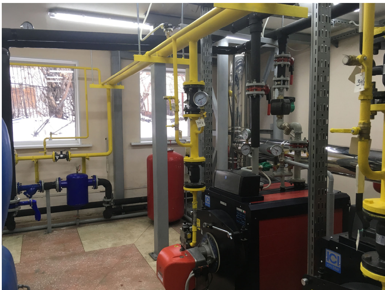
Новая газовая котельная 2017 г