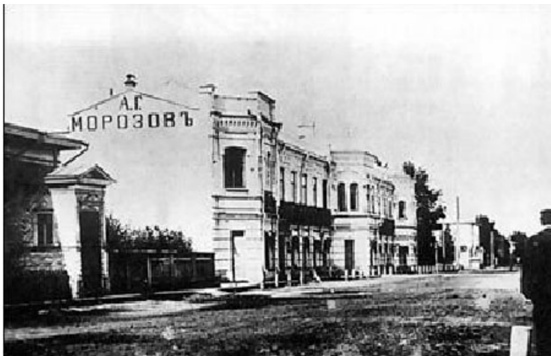
Петропавловская улица. Вид со стороны Соборной площади. Фото начала XX века.