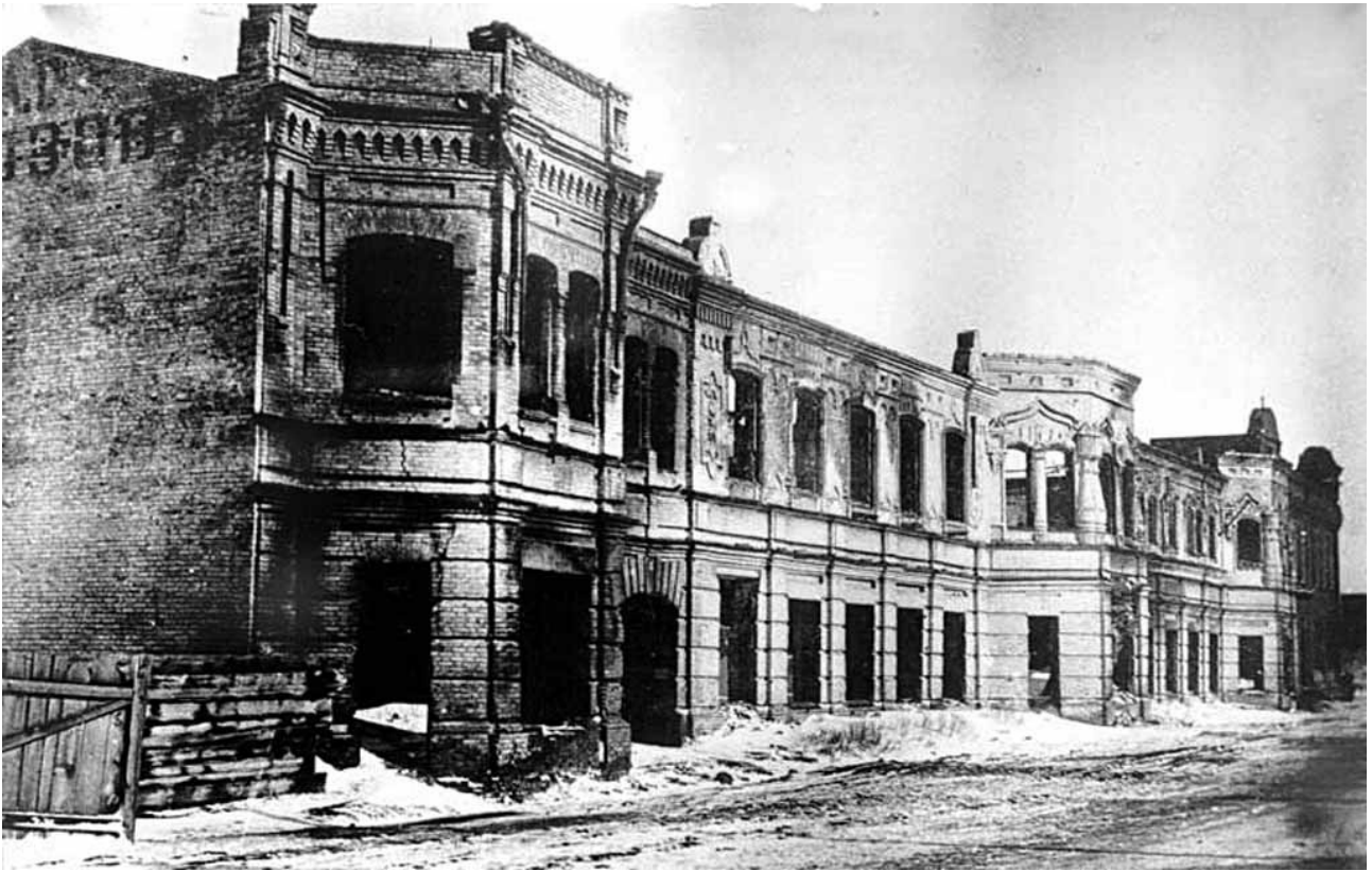
Торговый дом купца Морозова после пожара 1917 года.

В 1920 году здание было национализировано и занято под воинский постой. В январе 1920 года магазин Морозова по Петропавловской улице был занят 2-м Барабинским Революционным полком, затем 2-ой прифронтной батареей.