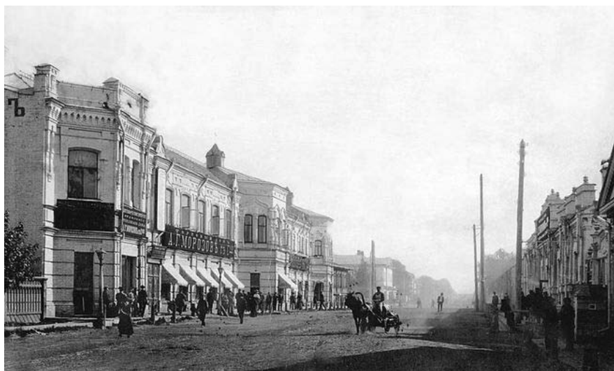
Торговый дом купца Морозова. Фото начала XX века С.И. Борисова

На карте г. Барнаула за 1907 г. дом обозначен как галантерейно-розничный и оптовый магазин Морозова по ул. Петропавловской (ныне ул. Ползунова). На первом этаже размещались магазины купца - оптовый мануфактурный магазин, розничный бакалейно-галантерейный и посудный. Второй этаж снимало в аренду Барнаульское отделение Русско-Азиатского банка (ныне Росбанк, который до 2022 входил в состав французского Societe Generale Group).