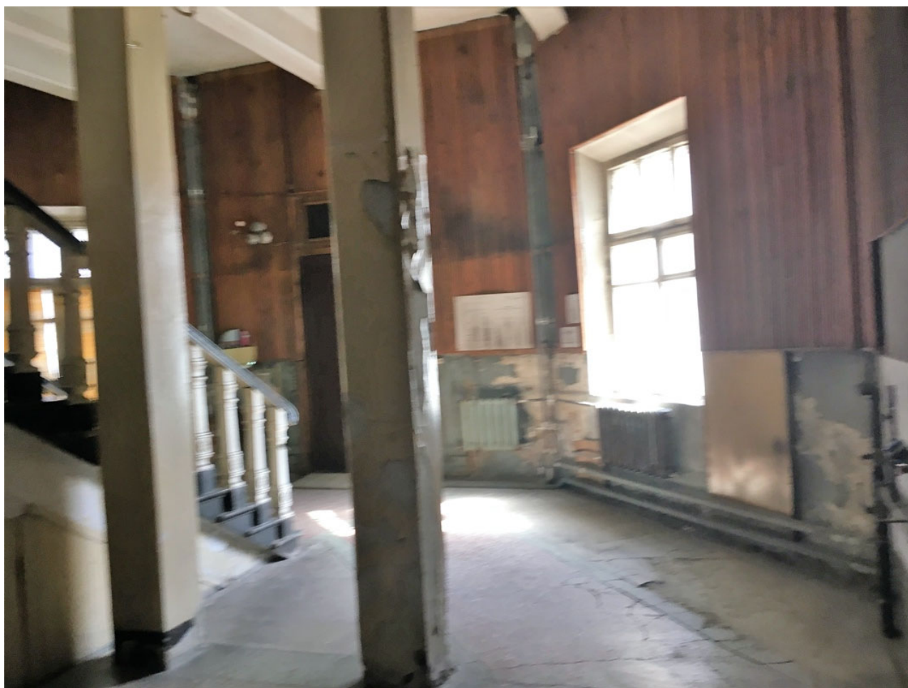
Парадная лестница в 2017 г