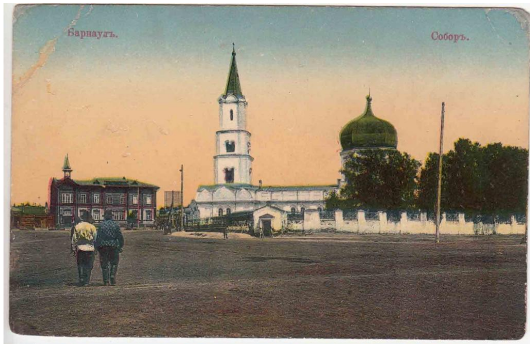
Фото-открытка. Петропавловский собор г. Барнаула с частично замененной оградой. Нач. XX в.