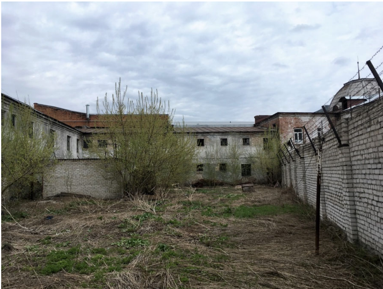
Изолятор временного содержания во дворе здания по Ползунова 34А Вид со двора ИВС. Справа видно примыкание оградки и здания ИВС к торцу здания Ползунова 34 А

стройка была остановлена. Возобновление строительства парковки запланировано на 2023 г.