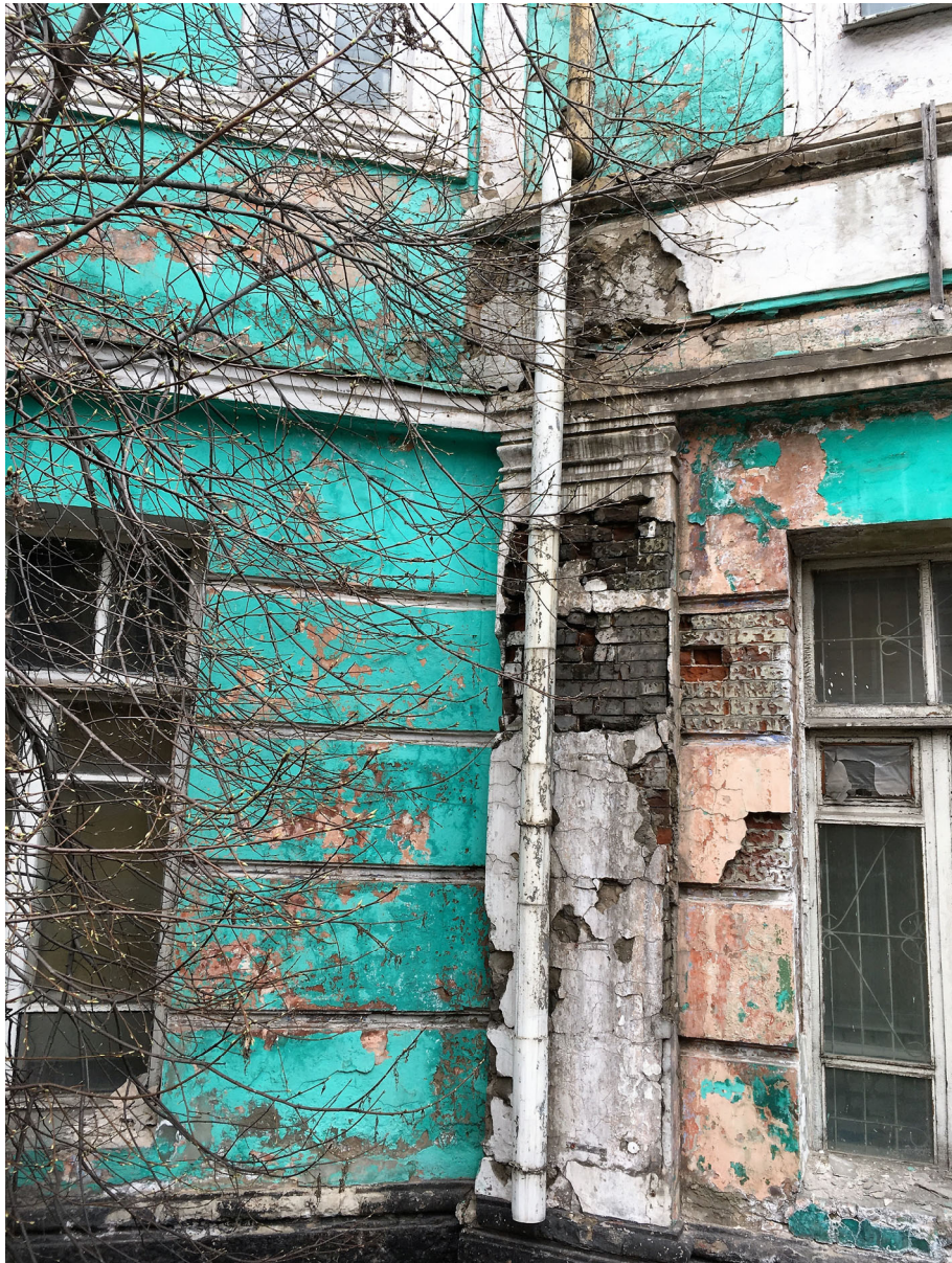
Фасад 2017 г.