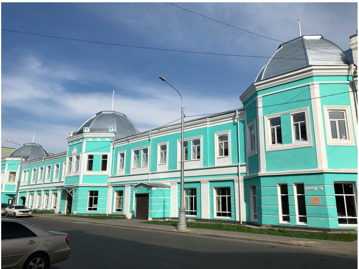
Фасад и купола после ремонта 2018 г.