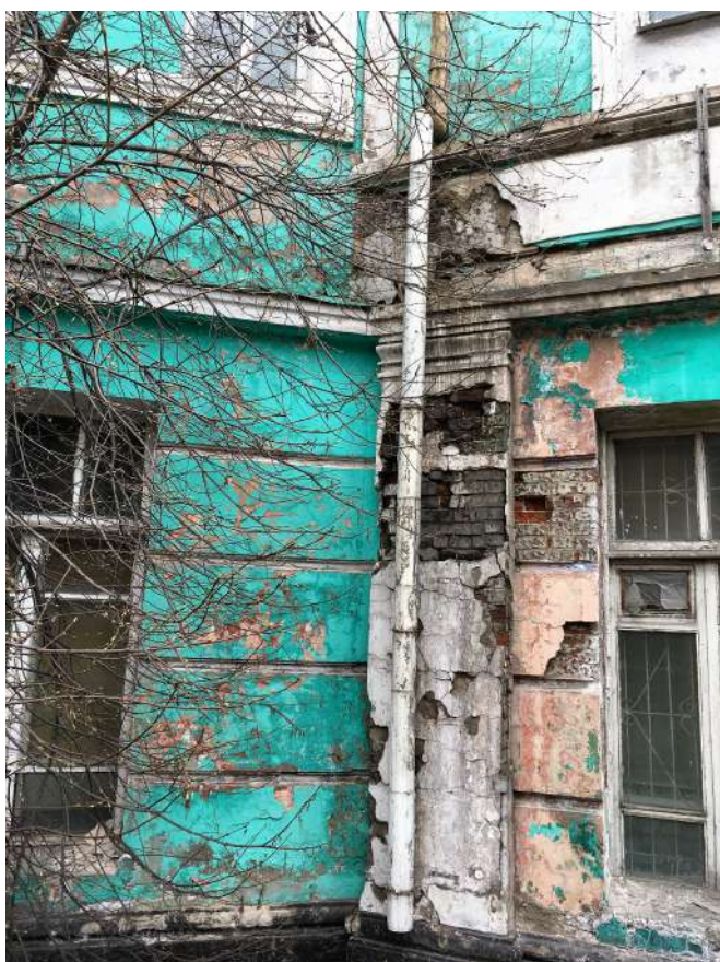
Фасад в 2017 г