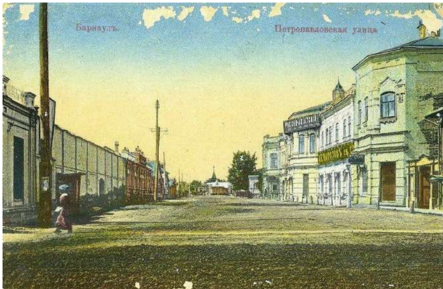
Петровская улица (ныне ул. Ползунова) при пересечении с Московским (ныне Ленинским) проспектом. Открытка начала XX века. Справа – Дом Морозова.

В 1913 г. Торговый дом «А.Г. Морозов и Сыновья» имел в этом здании оптовый мануфактурный магазин, розничный галантерейный магазин и вино-бакалейный магазин, верхний этаж занимал Русско-Азиатский банк. Позже внизу находился магазин «Сотрудник» и колбасная лавка.