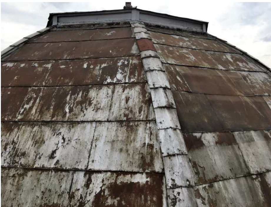
Кровля в 2017 г