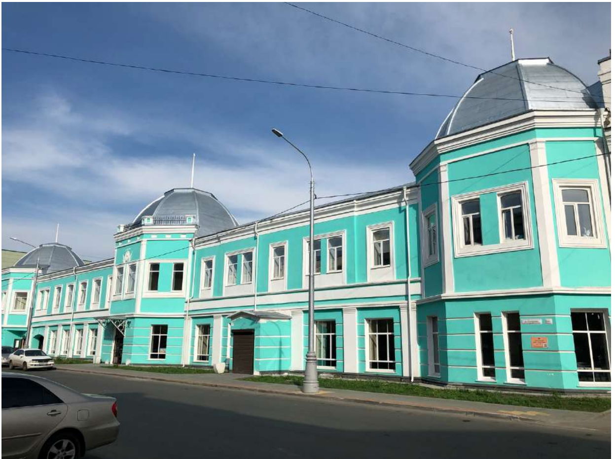
Фасад и купола после ремонта 2018 г.