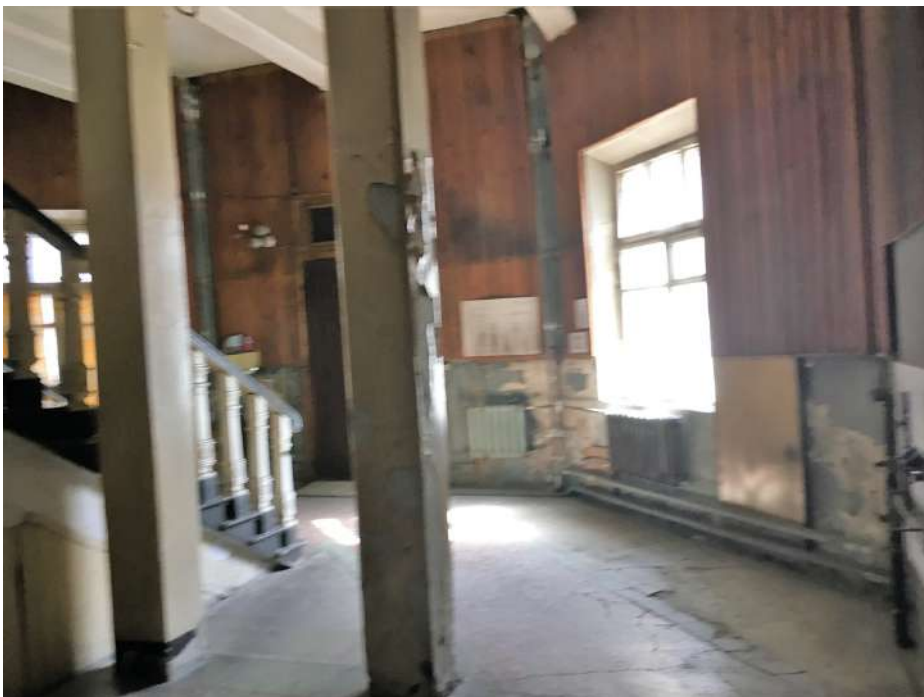
Парадная лестница в 2017 г