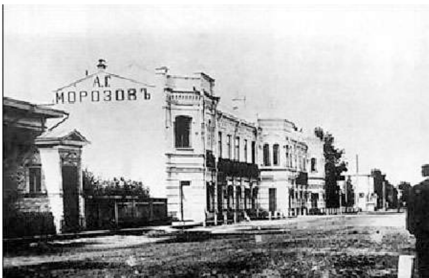
Петропавловская улица. Вид со стороны Соборной площади. Фото начала XX века.

торговлю самыми разнообразными товарами, от иголок до сельскохозяйственной техники, а также виноградными винами. Торговому дому принадлежало 8 магазинов, в том числе и оптовых, а обороты достигали 4 млн рублей в год.