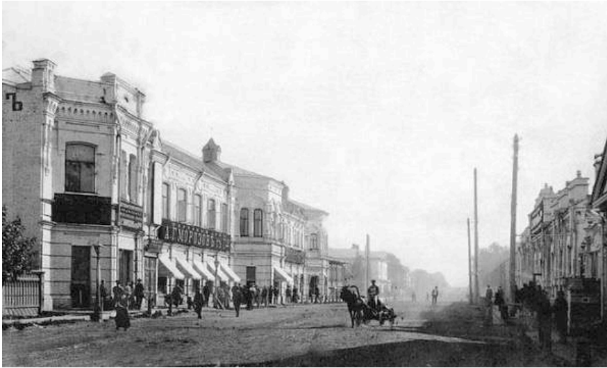
Торговый дом купца Морозова. Фото начала XX века С.И. Борисова

В 1913 г. Торговый дом «А.Г. Морозов и Сыновья» имел в этом здании оптовый мануфактурный магазин, розничный галантерейный магазин и вино-бакалейный магазин, верхний этаж занимал Русско-Азиатский банк. Позже внизу находился магазин «Сотрудник» и колбасная лавка.