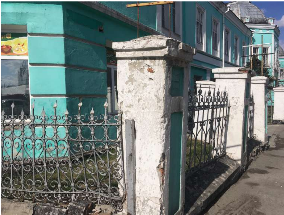
Ограда и фасад здания в 2017 году

За время своего существования здание несколько раз меняло адреса. Сначала оно находилось на ул. Петропавловской, затем, в советский период, улицу переименовали в ул. Республики. Здание имело адрес: ул. Республики, 38 (32), а потом - ул. Ползунова, 34а.