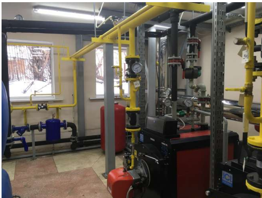
Новая газовая котельная 2017 г

водоотведение. В 2019 г. кованная оградка от Петропавловского Собора была демонтирована и возвращена историческому владельцу – Русской Православной Церкви.