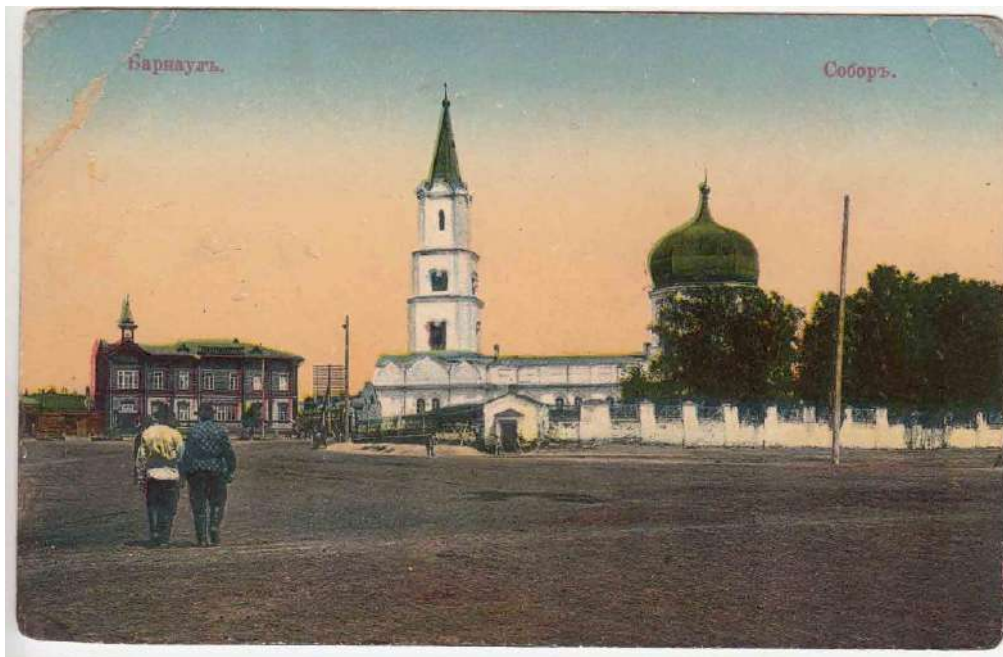
Фото-открытка. Петропавловский собор г. Барнаула с частично замененной оградой. Нач. XX в.

Вдоль здания была смонтирована кованная оградка. Ее перенесли с разрушенного главного православного храма Барнаула - Петропавловского Собора.